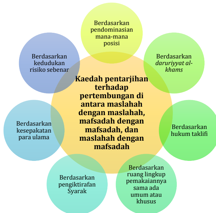
Rajah 2: Kaedah pentarjihan terhadap pertembungan di antara masalahah dengan masalahah, mafsadah dengan mafsadah, dan masalahah dengan mafsadah (R. Ahmad, 2004; al-Shāṭibi, 2011; Ibn 'Abd al-Salām, 2020)

Manakala bagi kaedah pentarjihan terhadap pertembungan di antara masalahah dengan mafsadah, para fuqaha telah menggariskan tujuh kaedah sepertimana pada Rajah 2 di bawah.