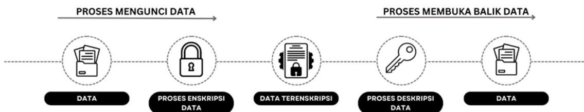
Rajah 1: Gambaran Proses Enskripsi

Dalam pada itu, pemahaman yang mendalam mengenai sistem teknologi yang digunakan dalam platform perjudian dalam talian adalah sangat signifikan melihat kepada kesukaran penjejakan aktiviti tersebut. Pihak penguatkuasa perlu memahami sistem laman sesawang yang digunakan, mekanisme pembayaran, cara permainan berfungsi, dan proses penarikan dana yang diaplikasikan dalam platform tersebut. Dengan pengetahuan yang komprehensif tentang sistem ini, pihak penguatkuasa dapat mengenal pasti elemen-elemen kesalahan dan pelanggaran yang berlaku sekali gus mengumpulkan bukti yang mencukupi untuk tindakan pendakwaan.