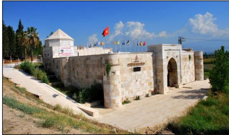
Gambar 11: Caravanserai Akhan selepas pemulihan