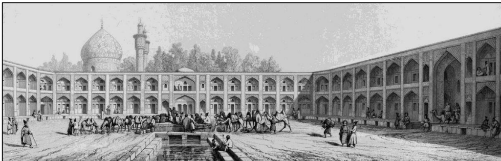
Gambar 5: Caravanserai Madar Shah

Caravanserai ini berbentuk segi empat tepat yang terdiri daripada dua tingkat dan mempunyai empat anjung pada pelan struktur bangunan yang dihiasi dengan batu bata dan jubin. Caravanserai ini juga mempunyai sebuah aliran yang dikenali sebagai aliran Farshadi yang mengalir melalui halamannya. Caravanserai ini dilengkapi dengan pelbagai kemudahan antaranya ialah kedai, kandang dan tempat simpanan air. Seperti yang ditunjukkan pada gambar rajah di bawah ia merupakan ilustrasi yang digambarkan oleh Pascal Coste, iaitu seorang pelukis, arkitek dan orientalis Perancis yang melawat Isfahan pada tahun 1805.