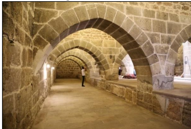
Gambar 10: Ruang dalam Caravanserai Zazadin Han

Selain itu, Caravanserai ini terletak di Laluan Sutera, kira-kira 22 km dari Konya. Tujuan pembinaan caravanserai ini untuk digunakan ketika musim bunga dan musim panas (Yilmaz et al., 2008). Fungsinya pada ketika itu adalah sebagai sebuah tempat perhentian para pelancong. Caravanserai ini turut dilengkapi dengan pelbagai kemudahan antaranya ialah terdapat 24 bilik, bilik mandi, gudang dan kandang. Pelan struktur bangunan ini mempunyai dua menara di bahagian sudut dan 11 menara di bahagian luar dan dihiasi dengan seni bina zaman Seljuk. Tarikan yang terdapat pada caravanserai ini menurut Dogan (2019) ialah “with dark and light brown hand-cut stones on its walls, the caravansary takes its visitor back to the Seljuks era, and fascinates local and international tourists”. Caravanserai ini bukan sahaja terkenal dengan terdapatnya dua sultan yang menjadi penaung semasa pembinaannya bahkan juga terkenal dari segi seni binanya. Oleh itu, para pelancong yang melawati Caravanserai Zazadin Han secara langsung akan dapat menikmati dan mengagumi keindahan dan keunikan seni bina yang menggambarkan zaman Seljuk. Namun begitu, Caravanserai Zazadin Han ditutup sementara untuk proses pemulihan pada bulan September 2017 dan dibuka semula kepada para pelancong pada bulan Ogos 2019.