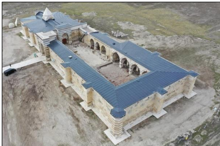
Gambar 9: Caravanserai Zazadin Han

Caravanserai Zazadin Han pula dibina pada tahun terakhir pemerintahan Sultan Alaeddin Keykubad (1235-1236) dan siap sepenuhnya semasa pemerintahan anaknya, iaitu Giyaseddin Keyhusrev II. Terdapat dua inskripsi pada Caravanserai Zazadin Han ini yang pertama adalah di pintu masuk caravanserai dan yang kedua adalah di pintu tempat perlindungan. Kedua-dua inskripsi ini memberikan maklumat bahawa pembinaan Caravanserai Zazadin Han siap pada tahun 1236 iaitu semasa pemerintahan Sultan Alaeddin Keykubad, manakala pembinaan halaman dan kemudahan lain siap pada tahun 1237 iaitu semasa pemerintahan Sultan Giyaseddin Keyhusrev II. Dalam pada itu, nama Saadeddin Köpek juga tertera pada salah satu inskripsi yang menyatakan bahawa beliau sebagai pengasas caravanserai ini (Önge, 2004). Oleh sebab itu, Caravanserai Zazadin Han ini juga dikenali sebagai Saadeddin Köpek Khan. Kewujudan Caravanserai Zazadin Han ini dinyatakan oleh Önge (2004) sebagai "the symbol of the power and personality of Sadeddin Köpek".