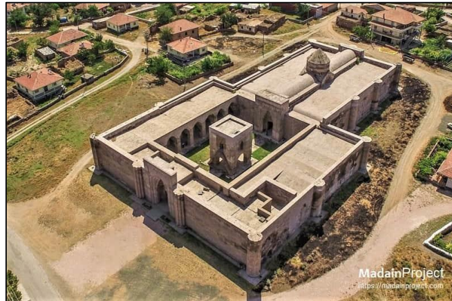
Gambar 8: Caravanserai Sultan Han

Selain itu, pengubahsuaian caravanserai ini dilakukan pada tahun 1278 semasa pemerintahan Giyaseddin Keyhusrev III. Namun, caravanserai ini telah diubahsuaikan sebanyak tiga kali. Terbaru adalah pada tahun 2009 (Polat, 2018). Pada hari ini, Caravanserai Sultan Han merupakan sebuah destinasi pelancongan utama di Turki dan menerima 500000 orang pelancong pada setiap tahun ( Daily Sabah , 2019). Pada tahun 2014, caravanserai ini termasuk dalam senarai sementara sebagai Tapak Warisan Dunia UNESCO ( Hurriyet Daily News , 2019).