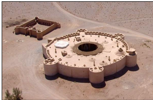
Gambar 3: Caravanserai Zeinodin