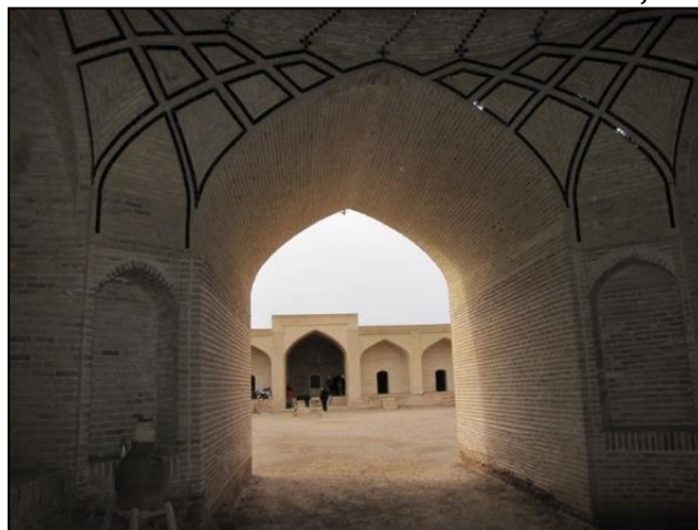
Gambar 2: Pintu masuk Caravanserai Maranjab

Kini, para pelancong yang berkunjung ke Gurun Maranjab memilih untuk menetap di caravanserai ini. Gurun Maranjab adalah salah satu padang pasir yang paling indah dan menakjubkan di Iran (Bakhtiari & Allahyari, 2018). Terdapat pelbagai tarikan pelancongan semula jadi di gurun ini seperti kepelbagaian spesies haiwan, tumbuh-tumbuhan, sebahagian besar padang pasir ditutupi dengan bukit-bukit berpasir ( Tehran Times , 2017). Dari segi keunikan seni bina, caravanserai ini hanya memiliki satu hiasan seni bina sahaja iaitu lengkungan buatan batu bata pada pintu masuk bilik seperti yang ditunjukkan pada gambar di bawah.