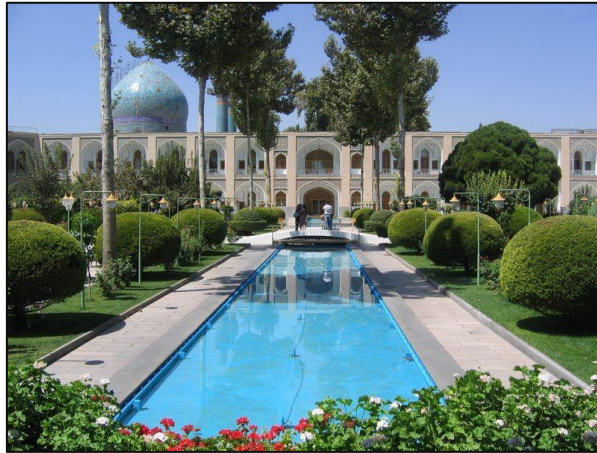
Gambar 6: Halaman Hotel Abbasi

dikatakan demikian kerana restoran ini memiliki suasana yang cantik dan indah kerana ia dihiasi dengan elemen klasik dan tradisional.