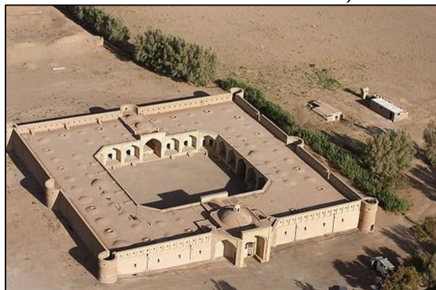
Gambar 1: Caravanserai Maranjab

Caravanserai adalah monumen bersejarah Iran yang telah dibina berabad-abad yang lalu untuk kemudahan dan keselesaan para pedagang dan pelancong. Sehingga abad ke-18 terdapat kira-kira 1800 buah caravanserai telah dibina di wilayah Isfahan (Bakhtiari & Allahyari, 2018). Antaranya ialah Caravanserai Maranjab. Ia dibina pada era pemerintahan kerajaan Safavid (1501-1736). Caravanserai ini dibina di tengah Padang Pasir Aran-Bidgol berhampiran dengan air tawar dan Qanat di selatan Salt Lake.