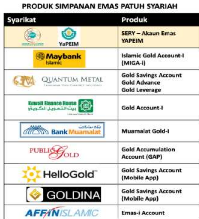
Gambar Rajah 1: Senarai Produk Simpanan Emas Patuh Syariah (Ustaz Lariba, 2021)

Dalam transaksi jual beli emas digital ini, qabd yang berlaku ialah qabd hukmiy di mana bukti transaksi akan dikeluarkan oleh syarikat emas atau pihak bank sebagai penjual yang memaparkan info lengkap emas yang dibeli iaitu jenis emas, berat emas, harga emas semasa pembelian dan rekod simpanan. Dengan itu, rekod pembelian akan dipaparkan menerusi skrin paparan digital dan seterusnya pembeli memiliki hak urus hartanya itu iaitu emas bagi tujuan simpanan, pengeluaran atau jualan semula, malah mungkin ada yang menyediakan urusan pajak gadai sebagaimana yang terdapat dalam perkhidmatan Public Gold menerusi Gold Accumulation Program (GAP) yang ditawarkan.