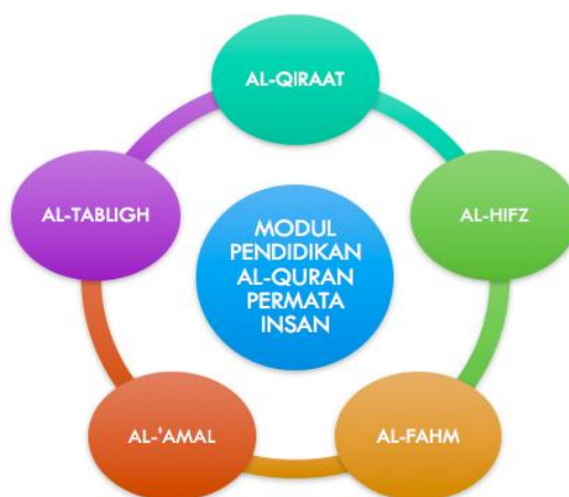
Rajah 1: Komponen Utama Modul Pendidikan al-Quran PERMATA Insan

Modul pendidikan Al-Quran PERMATA Insan mempunyai lima komponen utama iaitu al-qira'at , al-hifz , al-fahm , al-'amal dan al-tabligh . Lima komponen tersebut merupakan sebahagian besar daripada hak-hak al-Quran terhadap manusia seperti yang dibincangkan sebelum ini. Penjelasan lanjut bagi setiap komponen diperincikan sebagaimana dalam Rajah 1.